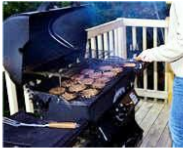
Pjek në skarë