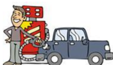
pompë e gazit