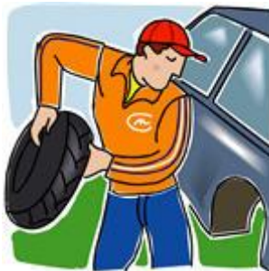
ndërroj e gomat