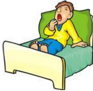
Më hapet goja