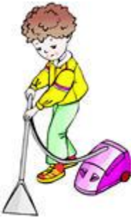
Fshij me aspirator